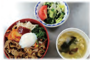
職員に大変好評だったビビンバ

茨城県常陸牛振興協会より、コロナ禍に大変な思いで医療に従事している医療従事者への感謝と応援、また笑顔になっていただきたいと常陸牛の贈呈がありました。贈呈された常陸牛は当センター栄養部で調理し、職員食堂で昼食として振舞われました。