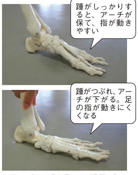
図1 上：正常な足 下：過剰回内